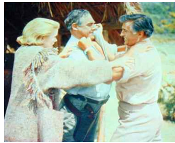
1954 L'ÉMERAUDE TRAGIQUE (Green Fire) d'Andrew Marton avec Grace Kelly, P. Douglas