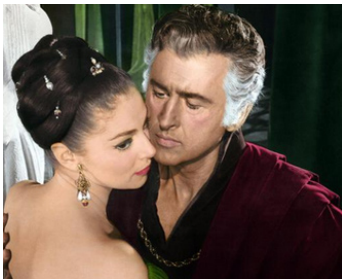
1961 SODOME ET GOMORRHE (Sodoma e Gomorra) de R. Aldrich & S. Leone avec Pier Angeli