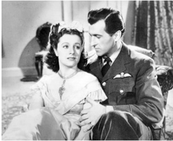
1944 ROMANCE D'AMOUR (Love Story) de Leslie Arliss avec Margaret Lockwood