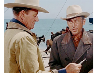
1960 LE GRAND SAM (North to Alaska) d'Henry Hathaway avec John Wayne