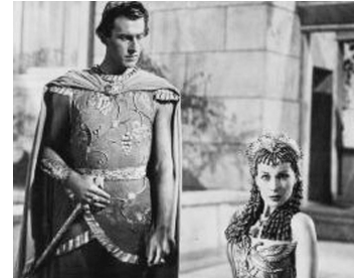
1945 CÉSAR ET CLÉOPÂTRE (Caesar and Cleopatra) de Gabriel Pascal avec Vivien Leigh