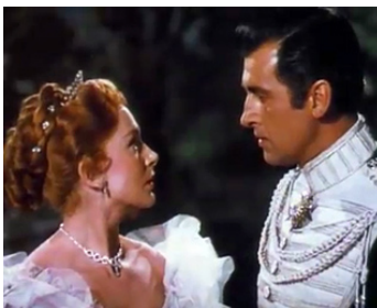
1952 LE PRISONNIER DE ZENDA (The Prisoner of Zenda) de Richard Thorpe avec Deborah Kerr