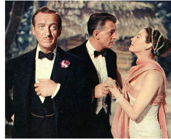
1957 LA PETITE HUTTE (The little Hut) de Mark Robson avec David Niven, Ava Gardner