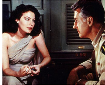
1956 LA CROISÉE DES DESTINS (Bhowani Junction) de George Cukor avec Ava Gardner