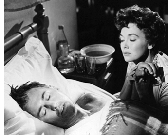
1958 HARRY BLACK ET LE TIGRE (Harry Black and the Tiger) d'H. Fregonese avec Barbara Rush