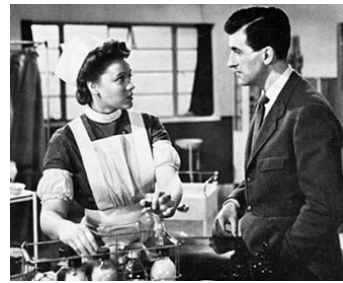
1943 COMBAT ÉTERNEL (The Lamp still burns) de Maurice Elvey avec Rosamund John