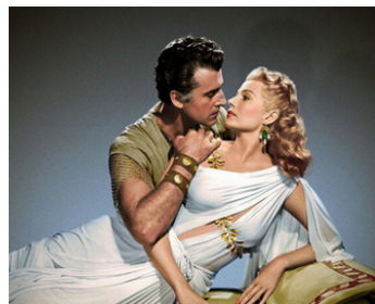
1952 SALOMÉ (Salome) de William Dieterle avec Rita Hayworth