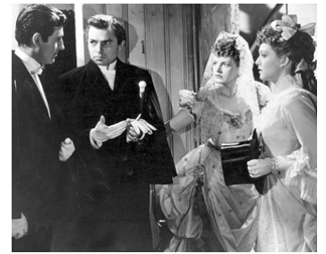
1944 L'HOMME FATAL (Fanny by Gaslight) d'A. Asquith avec J. Mason, M. Lockwood, P. Calvert