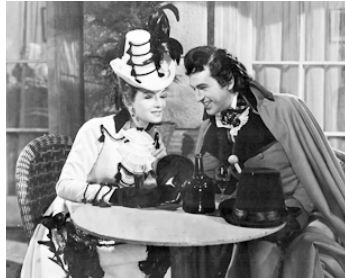
1946 L'ARCHET MAGIQUE (The Magic Bow) de Bernard Knowles avec Phyllis Calvert