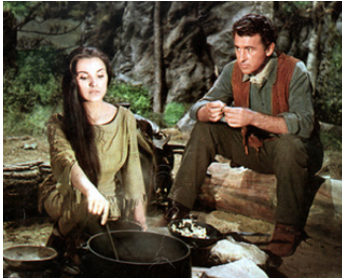
1956 LA DERNIÈRE CHASSE (The last Hunt) de Richard Brooks avec Debra Paget