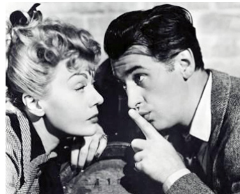
1948 LES ENNEMIS AMOUREUX (Woman Hater) de Terence Young avec Edwige Feuillère