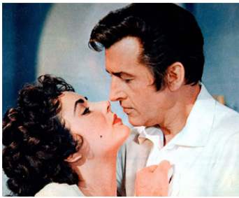
1954 LE BEAU BRUMMELL (Beau Brummell) de Curtis Bernhardt avec Elizabeth Taylor