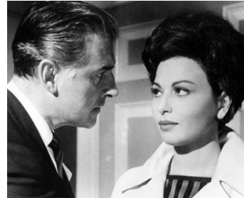
1960 SCOTLAND YARD CONTRE X (The secret Partner) de Basil Dearden avec Haya Harareet