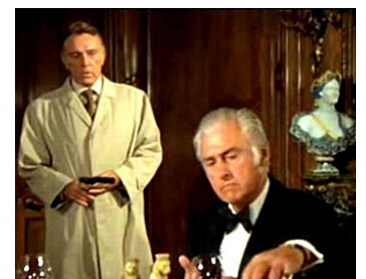
1977 LES OIES SAUVAGES (The Wild Geese) d'Andrew V. McLaglen avec Richard Burton