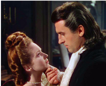
1948 SARABANDE (Saraband for dead Lovers) de Basil Dearden avec Joan Greenwood