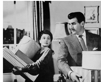
1949 ADAM ET ÈVELYNE (Adam and Evelyne) d'Harold French avec Jean Simmons