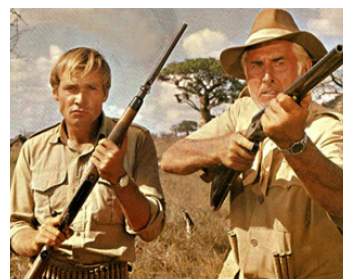
1967 LE DERNIER SAFARI (The last Safari) d'Henry Hathaway avec Kaz Garas