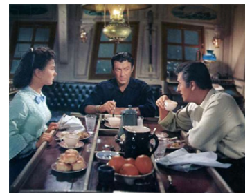
1953 LA PERLE NOIRE (All the Brothers were valiant) de R. Thorpe avec R. Taylor, Ann Blyth