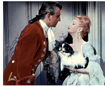
1955 LES CONTREBANDIERS DE MOONFLEET (Moonfleet) de F. Lang avec Joan Greenwood