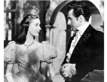
1947 JUSQU'À CE QUE MORT S'EN SUIVE (Blanche Fury) de Marc Allégret avec Valerie Hobson