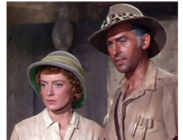
1950 LES MINES DU ROI SALOMON (King Salomon's Mines) de C. Bennett avec D. Kerr