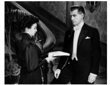
1955 DES PAS DANS LE BROUILLARD (Footsteps in the Fog) d'Arthur Lubin avec Jean Simmons