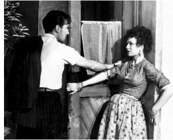
1944 LA MADONE AUX 2 VISAGES (Madonna of the seven moons) d'A. Crabtree avec Jean Kent