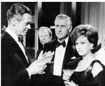
1965 THE CROKED ROAD de Don Chaffey avec Robert Ryan, Nadia Gray