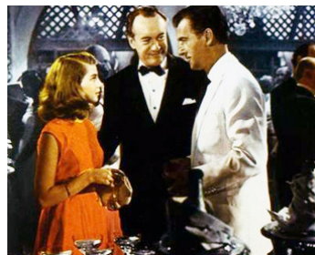
1951 MIRACLE À TUNIS (The Light Touch) de Richard Brooks avec Pier Angeli, G. Sanders