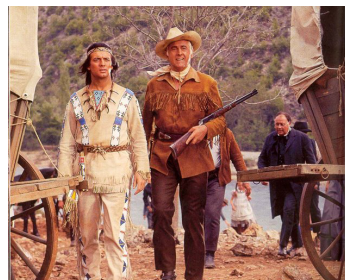
1965 L'APPÂT DE L'OR NOIR (Der Ölprinz) d'Harald Philipp avec Pierre Brice