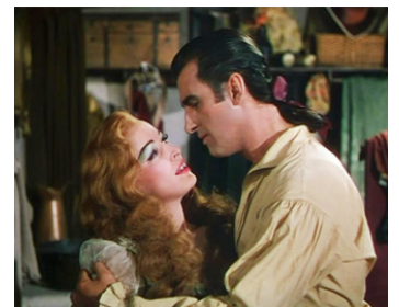
1952 SCARAMOUCHE (Scaramouche) de George Sidney avec Janet Leigh