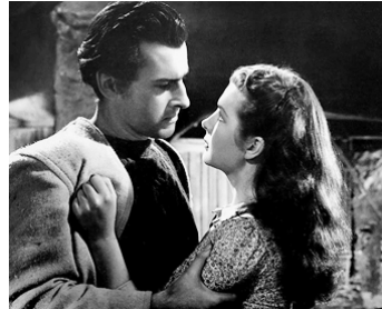
1947 CAPITAINE BOYCOTT (Captain Boycott) de Frank Launder avec Kathleen Ryan