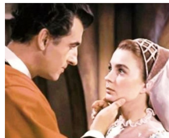
1953 LA REINE VIERGE (Young Bess) de George Sidney avec Jean Simmons