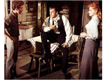
1957 TERREUR DANS LA VALLÉE (Gun Glory) de Roy Rowland avec S. Rowland, R. Fleming