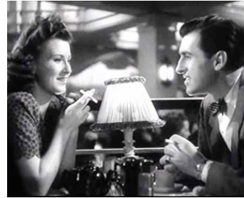
1944 UN SOIR DE RIXE (Waterloo Road) de Sidney Gilliat avec Joy Shelton