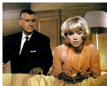
1966 LE SIGNE DU TRIGONE (The Trygon Factor) de Cyril Frankel avec Sabine Hardy