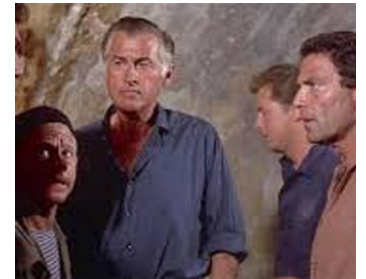
1963 L'INVASION SECRÈTE (The secret Invasion) de Roger Corman avec M. Rooney, R. Vallone