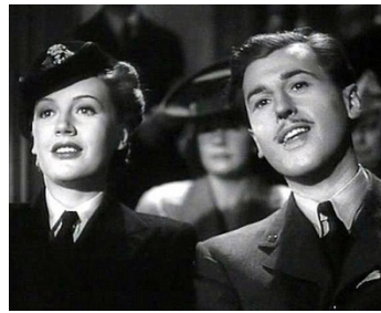
1943 L'HOMME EN GRIS (The Man in Grey) de Leslie Arliss avec Phyllis Calvert