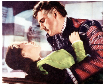
1961 LE MERCENAIRE (La Congiura del Diace) d'Étienne Périer avec Sylva Koscina