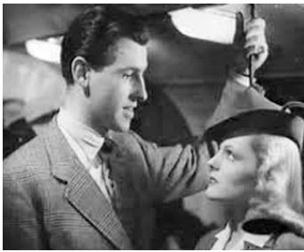
1943 L'ENFANT DU JEUDI (Thursday's Child) de Rodney Ackland avec Sally Ann Howes