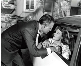
1958 LE CRIME ÉTAIT SIGNÉ (The Whole Truth) de John Guillermin avec Donna Reed