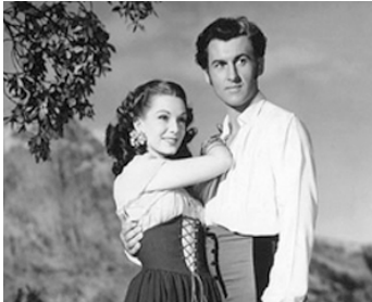
1945 CARAVANE (Caravan) d'Arthur Crabtree avec Jean Kent